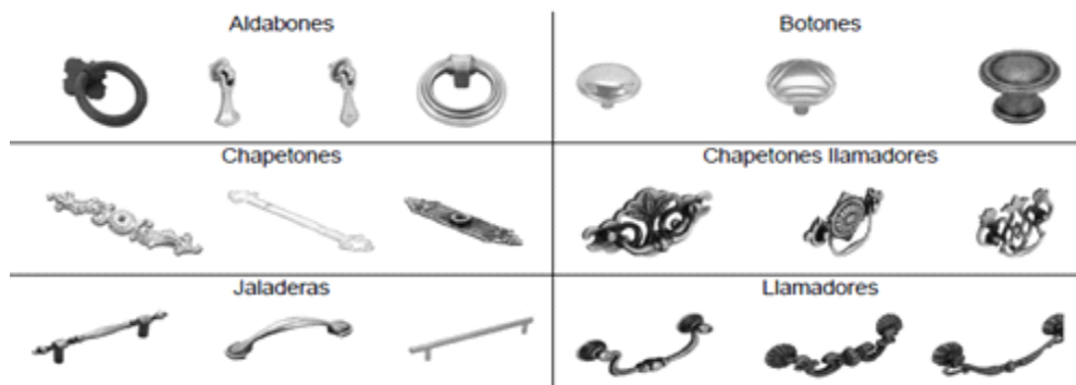
Ilustración 2. Jaladeras de zamac

9. Los tipos de jaladeras de zamac incluidos en la investigación son estrictamente jaladeras, botones, chapetones llamadores, llamadores, chapetones y aldabones, como los que se ejemplifican en la Ilustración 2.