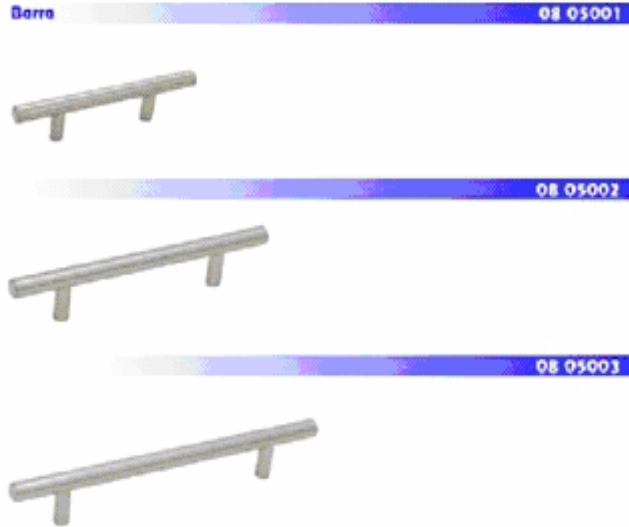
Ilustración 1. Jaladeras de acero

7. En el caso particular de las jaladeras de acero, son elaboradas a partir de acero redondo con cuerpo y patas de diámetro similares; por lo general, el cuerpo tiene un diámetro de 12, 14 o 16 milímetros (mm). Las medidas del cuerpo se determinan con base en la distancia entre centros más una variación de 30 mm a 60 mm, las medidas más comunes son 64; 96; 128; 160; 192; 224; 256; 288; 320; 352; 384; 416; 458; 480; 560; 640; 720; 800; 880; 960; 1,040 y 1,120, todas expresadas en mm, no obstante, existen medidas no convencionales de acuerdo con el productor, pero la altura es estándar (ver Ilustración 1).